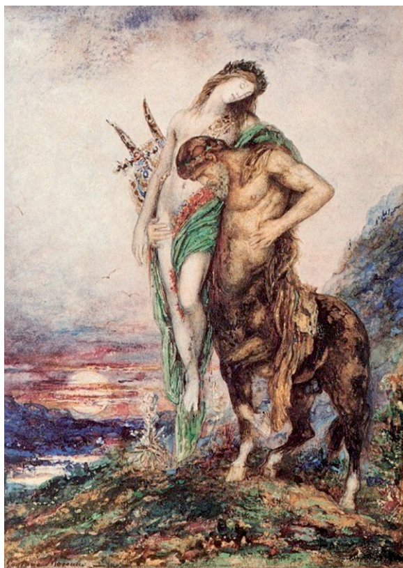
Gustave Moreau, Poeta morto sostenuto da un centauro, 1890